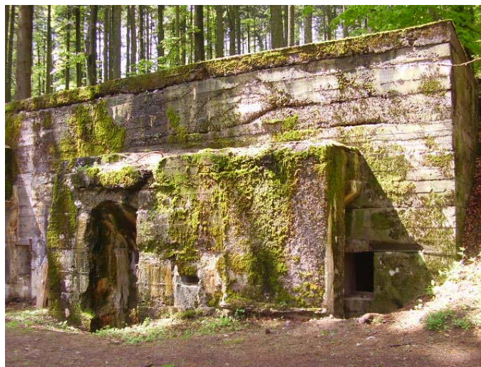
Abri « Zünfthaus II ».