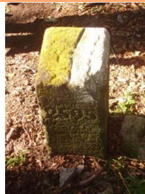
Bornes frontières-Photos : 905.